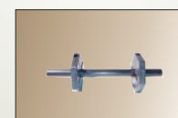
Ogranicznik rolki etykiet