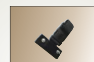
Uchwyt do paska zmienny