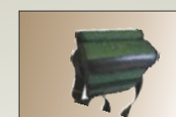
Torba na drukarkę