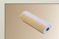
Papier termiczny 112mm x 30m lub 112mm x 20m